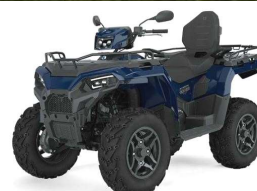
Sportsman 570 touring