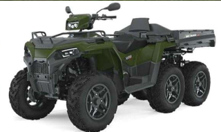
Sportsman 570 6x6