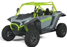
RZR XP 1000