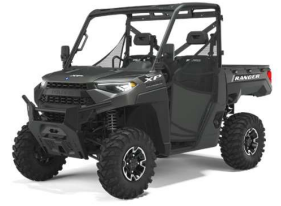
Ranger XP 1000