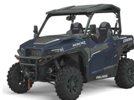
General 1000 deluxe