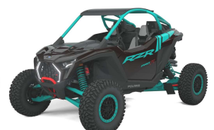
RZR Pro R