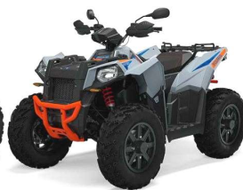
Scrambler XP 1000