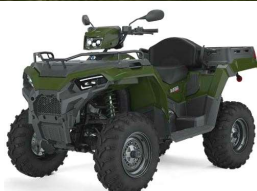
Sportsman 570 X2