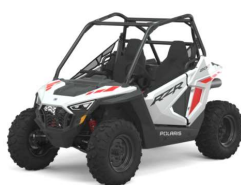
RZR 200 EFI