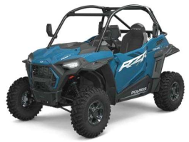
RZR Trail s 1000