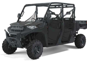
Ranger 1000 crew