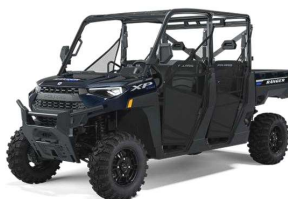
Ranger XP 1000 crew