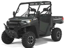
Ranger XP 1000