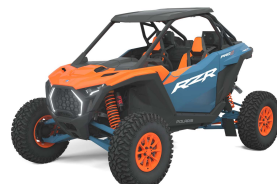
RZR Pro S