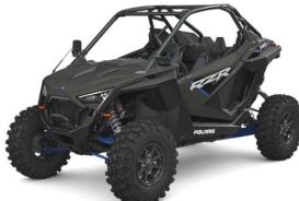
RZR Pro XP