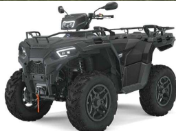
Sportsman 570 BE