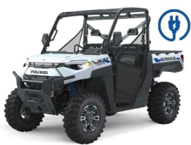
Ranger Kinetic electric