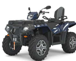
Sportsman XP1000 touring