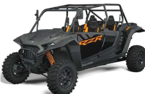
RZR XP 4 1000