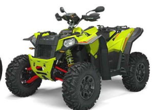
Scrambler XP 1000 S